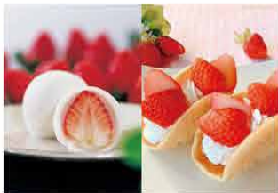
金蝶園総本家 [大垣市]

桃のような香りのする苺「ももか」、「完熟よつぼし」、「美濃娘」、このイベント限定で昨年人気でしたバラの香りの「華かがりRose」などのふわもち苺を販売いたします。