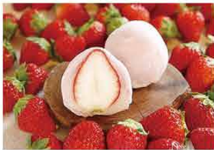
揖斐菓匠庵みわ屋 [揖斐郡]

温故知新をモットーに伝統的な和菓子から和洋折衷の創作菓子までお作りします。素材を大切に手間暇を惜しまず。