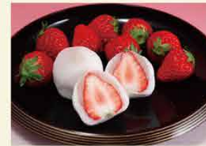
和菓子処 関市虎屋 [関市]

岐阜市別武に一昨年オープンしたプリンセスのお茶会をコンセプトにした洋菓子店。フランスと福岡で修行したパティシエが心を込めて作りました。醍醐卵でふっくら焼き上げたカスターラで岐阜いちごをサンドしたカスターラサンドを販売。