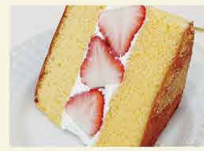
伸光製菓パティスリー-kura [岐阜市]

季節の上生菓子を専門とする和菓子店です。菓箱に入った、栗生もち4種4個箱入りセットを販売。