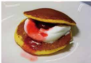
松浦軒本店 [恵那市]

「うかい鮎」などの各種お土産、和菓子を製造・販売。いちご大福は白あんと粒あんの2種類をご用意。生クリーム入りのミルク餡を使った「いちごみるく大福」も限定販売予定です。