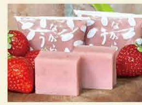
長良ういろ [山県市]

西美濃の豊かな歴史・文化・風土を描いたお菓子を作り、地産地消にも取り組んでいます。