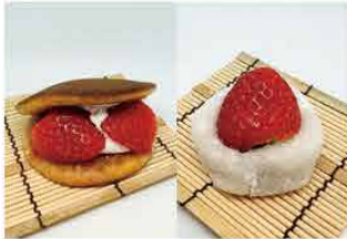
末廣屋本店 [岐阜市]

米粉のパウムクーヘン専門店です。おいしいお米の魅力を改めて感じていただきたいです。