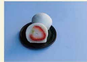
尾張屋昌常 [海津市]

池田山の麓に佇む小さな和菓子屋。「幸せ和菓子」をモットーにまごころ込めてお届けします。「あげばん」と「どら焼き」が一番人気のお店です。