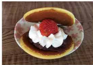
戸谷製菓舗 [海津市]

お菓子を口にする人々の健康の為、その上で吟味した良質な素材を使用し常に安心安全な美味しい菓子の提供を心がけています。