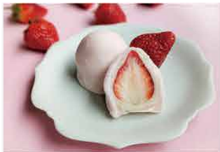
亀甲屋本舗 [岐阜市]

「うかい鮎」などの各種お土産、和菓子を製造・販売。いちご大福は白あんと粒あんの2種類をご用意。生クリーム入りのミルク餡を使った「いちごみるく大福」も限定販売予定です。