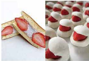
みのかも金蝶堂 [美濃加茂市]

岐阜県恵那市岩村町で200年以上続く菓子屋です。名物カスターラと季節の和菓子を販売。