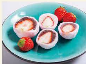
御菓子所 吉野屋 [本巣市]

栗おこわ、安納芋かりんとう饅頭、栗きんとん、安納芋を使用した手バージョンのかりんとう饅頭を販売。