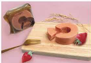
尾崎餅店 ファボール飛騨 [高山市]

創業1798年、水の都 大垣の老舗和菓子店。約40年、変わらぬ味のいちご餅がおすすめの逸品です。