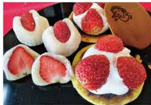
岐阜 金蝶堂 [岐阜市]

苺を使った生どら焼、大福、生クリーム餅の他にも季節の和菓子を取り揃えて、お待ちしております。